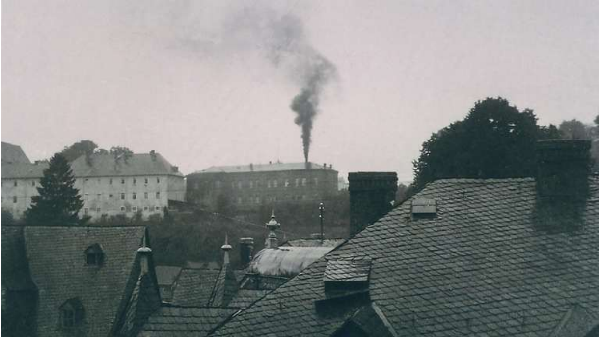
Abbildung 7 Die Rauchfahne des Krematoriums in Hadamar war weithin sichtbar. Foto aus dem Sommer 1941.