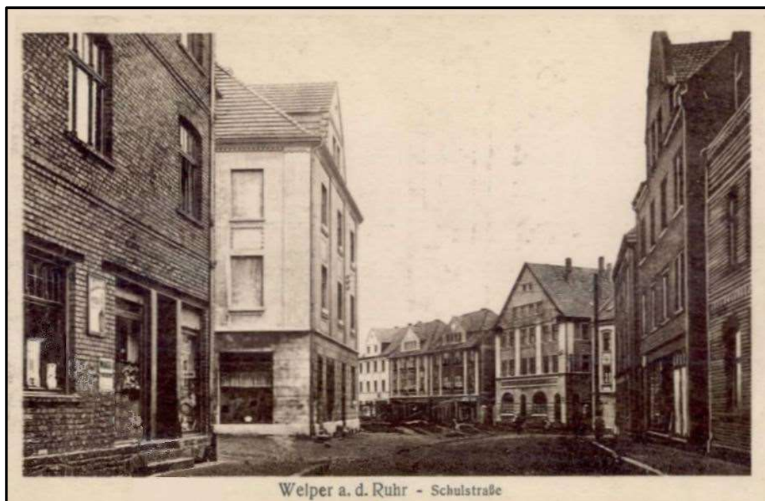
Abbildung 2 Postkarte, ungelauten, aus dem Verlag Mch. Gerhardt, Welper