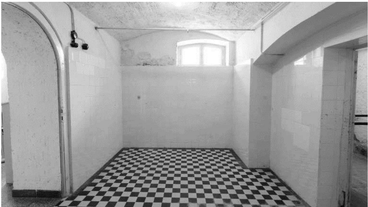
Abbildung 6 Die ehemalige Gaskammer in Hadamar

Dann wurden die Menschen in die im Keller gelegene Gaskammer gebracht. Dieser etwa 15 Quadratmeter große geflieste Raum war mit einem kleinen doppelflügeligen Fenster ausgestattet und sah zur Täuschung der Opfer wie ein „Duschraum“ aus. Nachdem die Tür abgeschlossen war und im Nebenraum die Gasflasche geöffnet wurde, strömte Kohlenmonoxid aus den „Duschköpfen“ und aus den in etwa einem Meter Höhe verlaufenden perforierten Zuleitungen. Nach zehn bis fünfzehn Minuten erstickten die Menschen.